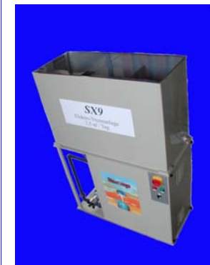
SX9 installation d'électro-séparation